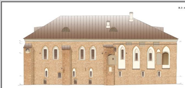
Северный фасад. Эскизный проект реставрации. 2008 г.