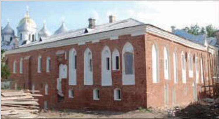
Фото после реставрации. 2010 г.