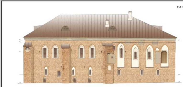
Северный фасад. Эскизный проект реставрации. 2008 г.